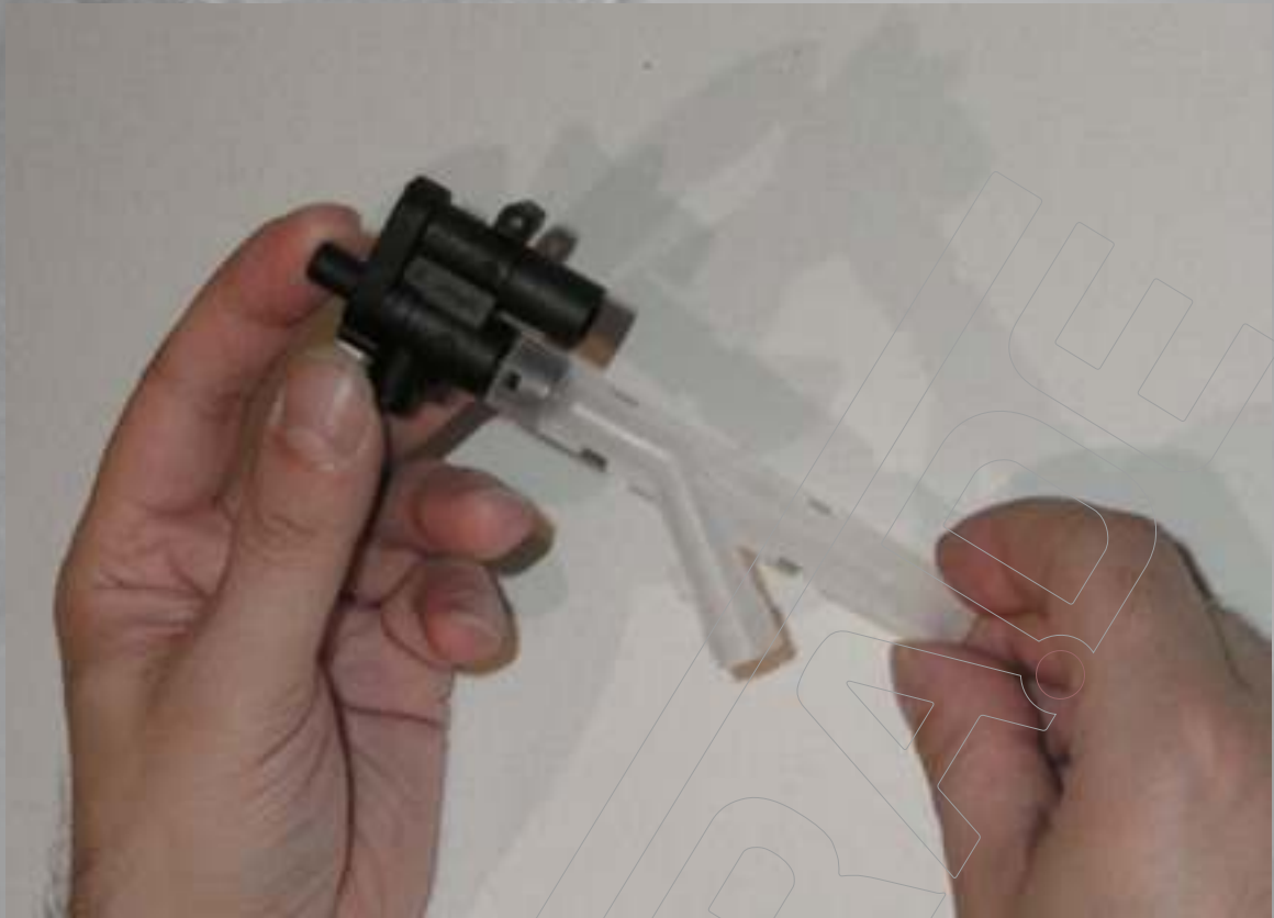
Das Drainageventil in Grundstellung.