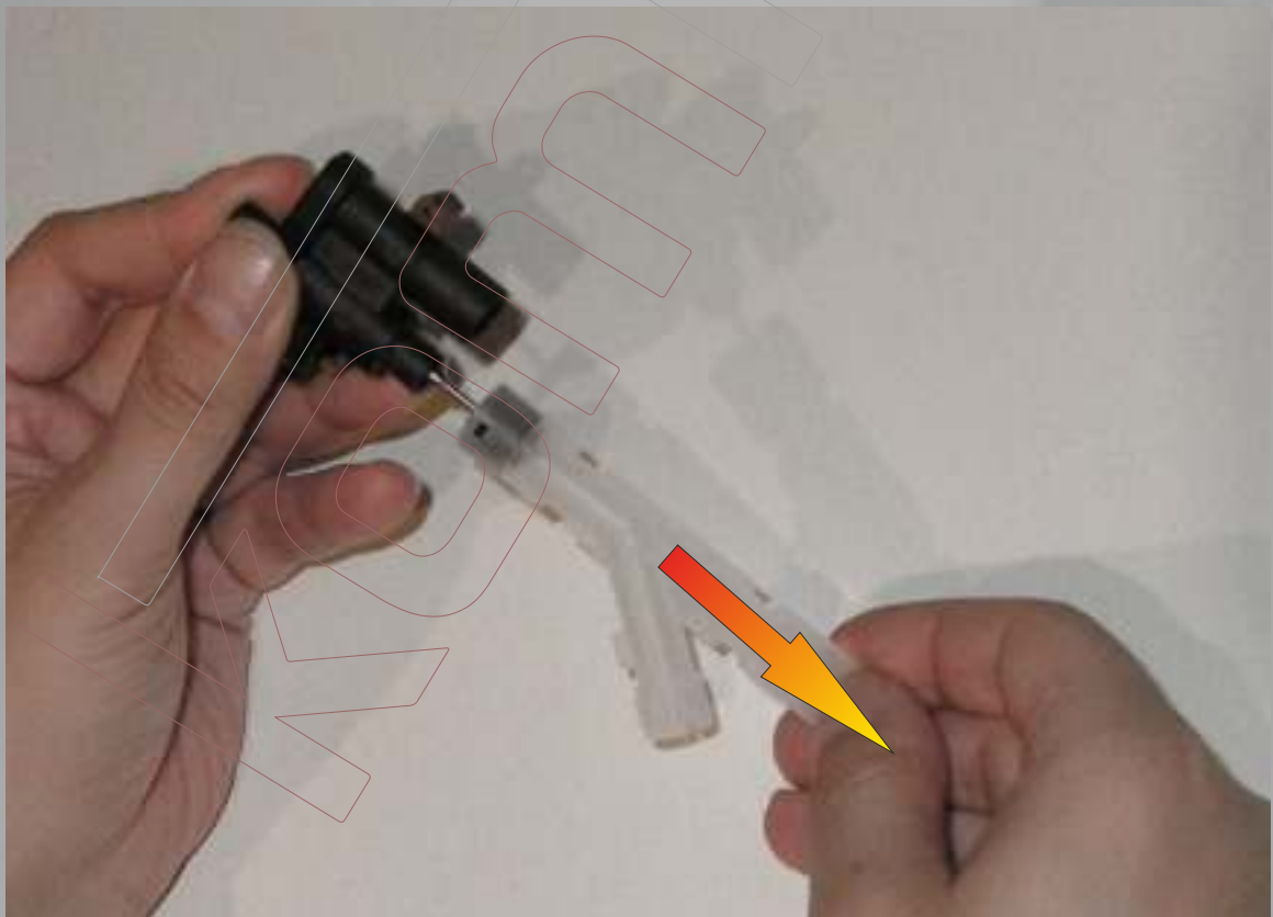
Das transparente Teil mit dem Metallkolben vorsichtig aus dem Ventilkörper ziehen.